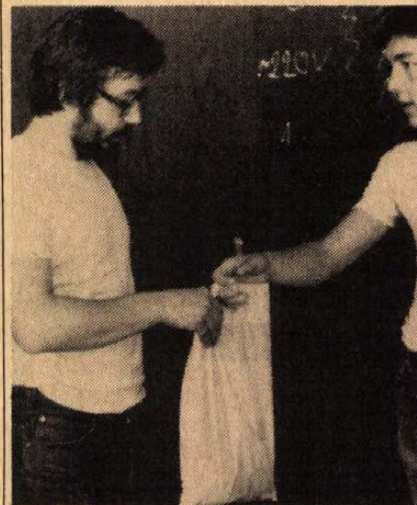
Mi van a zacskóban?

S hogy ez az állítás korántsem valamiféle megalapozatlan kijelentés, bizonyítékért benyitunk a modern közművelődési intézmény egyik