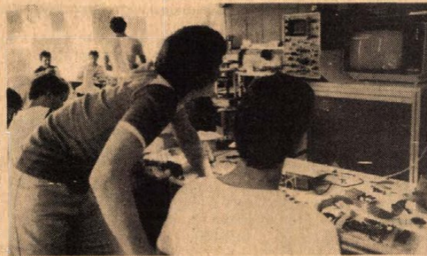
Most kiderül, hogy működik-e.

Egyértelműen üdvözlőnk kell tehát a művelődési központ országunkban eddig még egyedülálló kezdeményezését. Az egyedülálló kifejezésen azonban talán érdemes egy kicsit elgondolkozni. Bizonyval hasznos lenne, ha másutt is lehetőség nyílna hasonló, s viszonylag olcsó személyi számítógépek építésére, hogy ezáltal is több családba juthasson el a korszerű elektronika e hasznos vívmánya. Arról nem is beszélve, hogy az iskolák, a szakkörök ily módon jelentősen bővíthetnek, szinesíthetnek számítógépparkjukat, tovább segítve a számítástechnikai ismeretek mielőbbi elterjedését. Nem biztos azonban, hogy az ilyen számítógépes egységcsomagok összeállítása, az alkatrészek gyártásának meg-